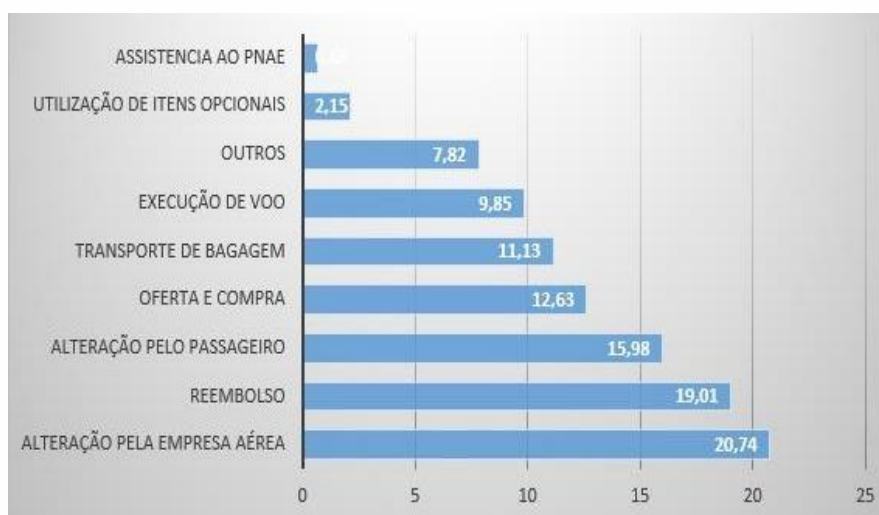
Gráfico 1 – Categorias de Reclamações Pelos Consumidores na Aviação

O Gráfico 1 mostra um panorama das queixas mais recorrentes registradas pelos consumidores no portal Consumidor.gov, sob a supervisão da ANAC. Identifica-se que a principal categoria de reclamação diz respeito a "Alterações pela empresa aérea", contabilizando 20,74% do total de registros.