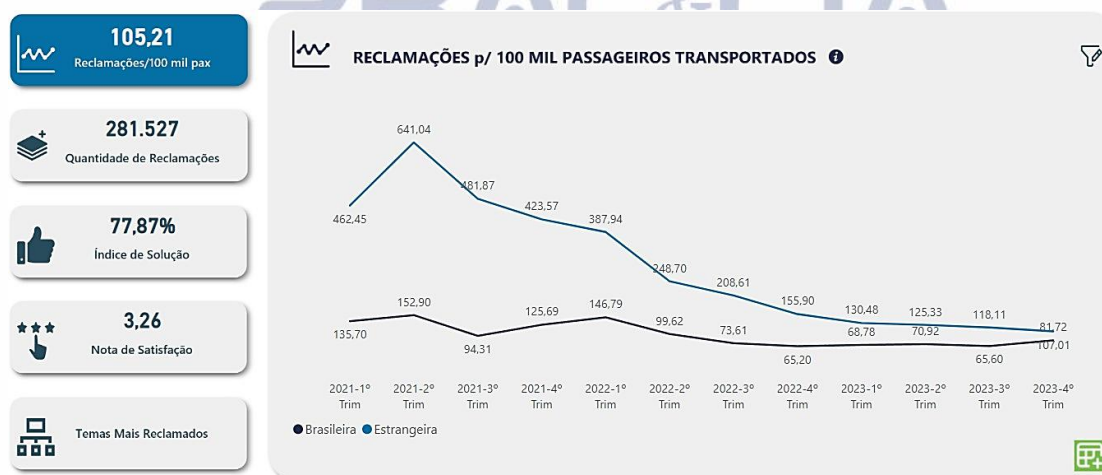
Gráfico 3 – Avaliação da Frequência de Reclamações

A análise do Gráfico 3 revela um pico significativo de reclamações no primeiro trimestre de 2021, atingindo aproximadamente 641,04 queixas por 100 mil passageiros, seguido de uma tendência flutuante de decréscimo até o quarto trimestre de 2023. Em 2023, observa-se uma taxa de 107,01. A variação observada pode estar associada a diversos fatores, incluindo alterações nas políticas das companhias, mudanças regulatórias, ou eventos específicos do setor que demandam uma investigação mais aprofundada.