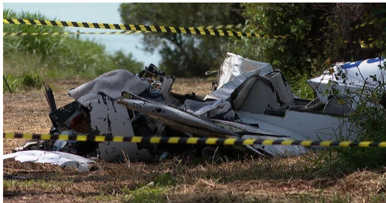
Figura 2 - Estado da aeronave