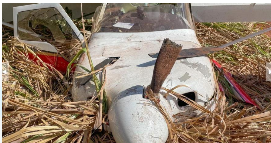
Figura 4 - Aeronave em solo.