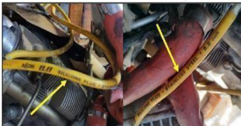
Figura 3 - Condição dos cabos de vela

A Figura 3 apresenta o uso incluindo de componentes não aeronáuticos, seu rótulo descrevia que a bateria era homologada pela norma ABNT NBR 15914 e NBR 15940, que explicitam baterias de chumbo ácido para veículos rodoviários, e a vela era a ACCEL 8.8 SILICONE PULS – STAINLESS STEEL 8.8 mm, também de aplicação automotiva, o que reflete a falta de rastreabilidade e a inadequação de materiais.