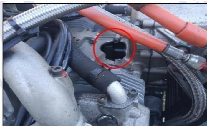
Figura6 - Ruptura do bloco do motor

Não houve comprovação de que os Alert Service Bulletins do fabricante do motor Rotax 912 ULS haviam sido cumpridos, e o mecânico responsável pela última inspeção não possuía treinamento específico para esse motor. A operação em potência de cruzeiro acima do recomendado pelo manual e a ausência de registros de manutenção detalhados agravaram o cenário de risco.