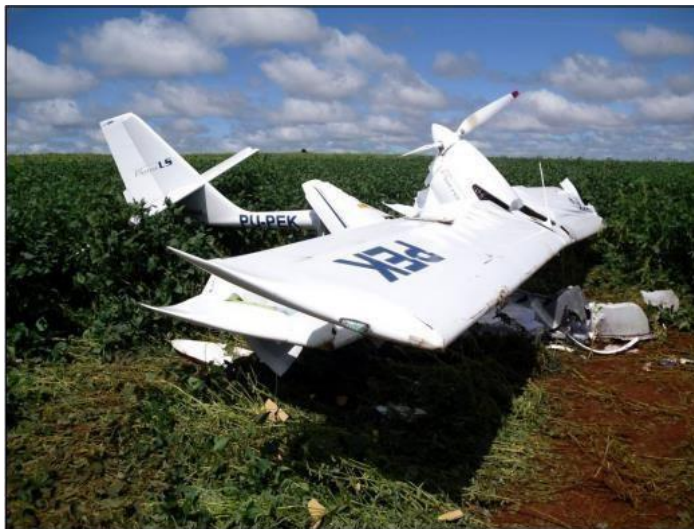
Figura 1 - Aeronave no solo, no local do acidente